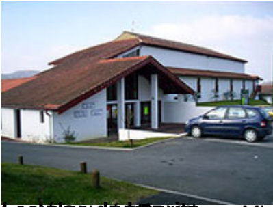
Les Écoles de l'école Michel Saint-Pierre